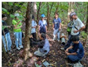
成長量調査の様子

専門家と連携し、小笠原諸島に樹生する樹木の成長量調査や、CO2吸収量の算定方法を確定