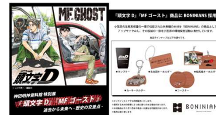
コラボ商品の開発

木材ブランド「BONINIANS」立上げ。IPとのコラボ商品の開発・販売。木材を活用したリコーダーを開発し、北海道やイギリスでの楽器フェアにて展示