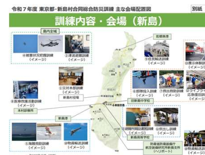
総合防災訓練の案内

島民・事業者向けの説明会実施や、「東京都・新島村合同防災訓練」など、各種イベントにおけるプロモーションの実施